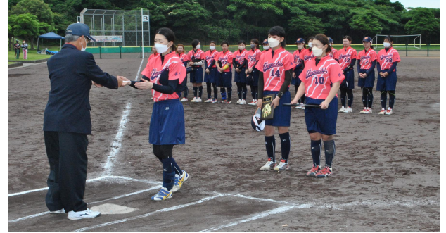
第3位・佐伯中央病院SC(大分県)